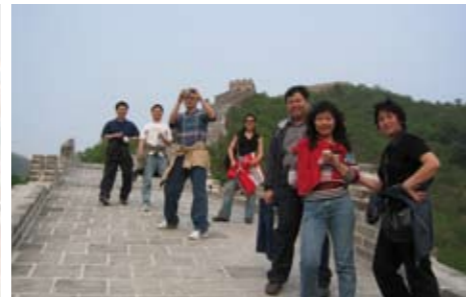
Das Team von Sauter Beijing

Für Sauter bedeutet dieses Projekt in Beijing eine bedeutende Wegmarke im chinesischen Markt, insbesondere was den Bereich Bürogebäude betrifft.